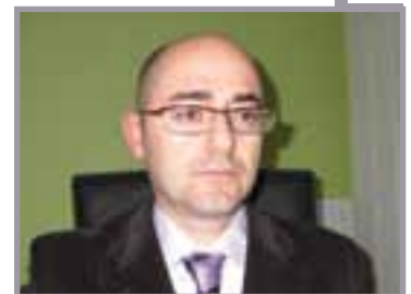
A cura di: Dott. Bartolini Marco Dottore Commercialista; Revisore dei Conti; Curatore fallimentare, Tribunale di Orvieto. Partner STUDIO RB

Si segnala, in ultimo, che è riconosciuto un vantaggio per quell'imprenditore che prenda in affitto un'azienda i cui lavoratori sono sottoposti al trattamento di CIGS: a egli è riconosciuto, in questo caso, il diritto alla prelazione nel caso della vendita dell'azienda.