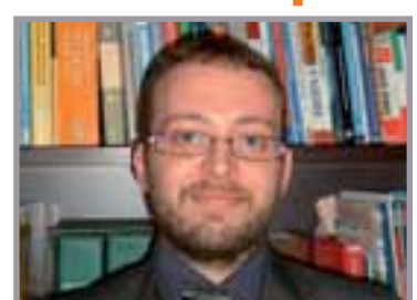
A cura di: Rag. Francesco Argentini Consulente del Lavoro. Partner STUDIO RB

scritta e convalidato da entrambe le parti e approvato dalla Direzione territoriale del lavoro dopo aver ascoltato il dipendente. In ogni caso si ricorda che dal 1° gennaio 2012, viene abrogata la convalida di trasformazione dei contratti di lavoro da tempo pieno a tempo parziale presso la Direzione territoriale del lavoro competente per territorio, così come previsto dalla Legge 183 del 12 novembre 2011.