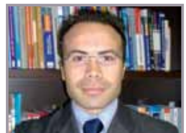
A cura di: Rag. Andrea Rellini Consulente fiscale e del Lavoro. Partner STUDIO RB

dai familiari conviventi. Le fatture o ricevute fiscali comprovanti le spese effettivamente sostenute insieme ai relativi bonifici bancari di pagamento.